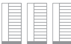
10 x LITE 90